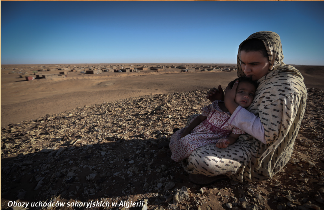
Obozy uchódców saharijskich w Algierii.

Ofiarami min lądowych i niewybuchów padło już ponad 2500 osób, w tym wiele dzieci. (dane za Action On Armed Violence). 18