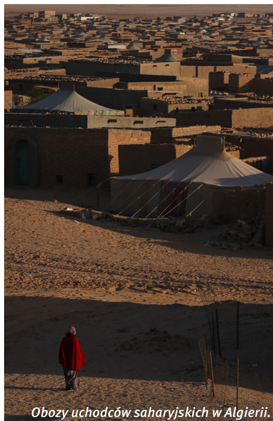
Obozy uchodźców saharyjskich w Algierii.

WSRW rekomenduje wywarcie presji na spółkę PGNiG tak aby spółka zależna (Geofizyka Kraków) niezwłocznie wycofała się z podjętych przedsięwzięć na terenie okupowanej Sahary Zachodniej.