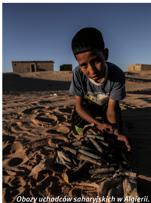
Obozy uchodźców saharijskich w Algierii.

Podczas konfliktu Maroko zbudowało długi na ponad 2200km mur obronny, dzielący tereny Sahary Zachodniej na dwie części. Mur ten jest największą strukturą wojskową na świecie. Strzeże go 160.000 żołnierzy oraz miliony min lądowych czyniąc z Sahary Zachodniej jedno z największych pól minowych na świecie. 17