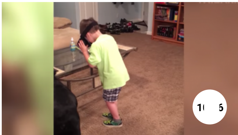
Video : les meilleurs Fails de 2018