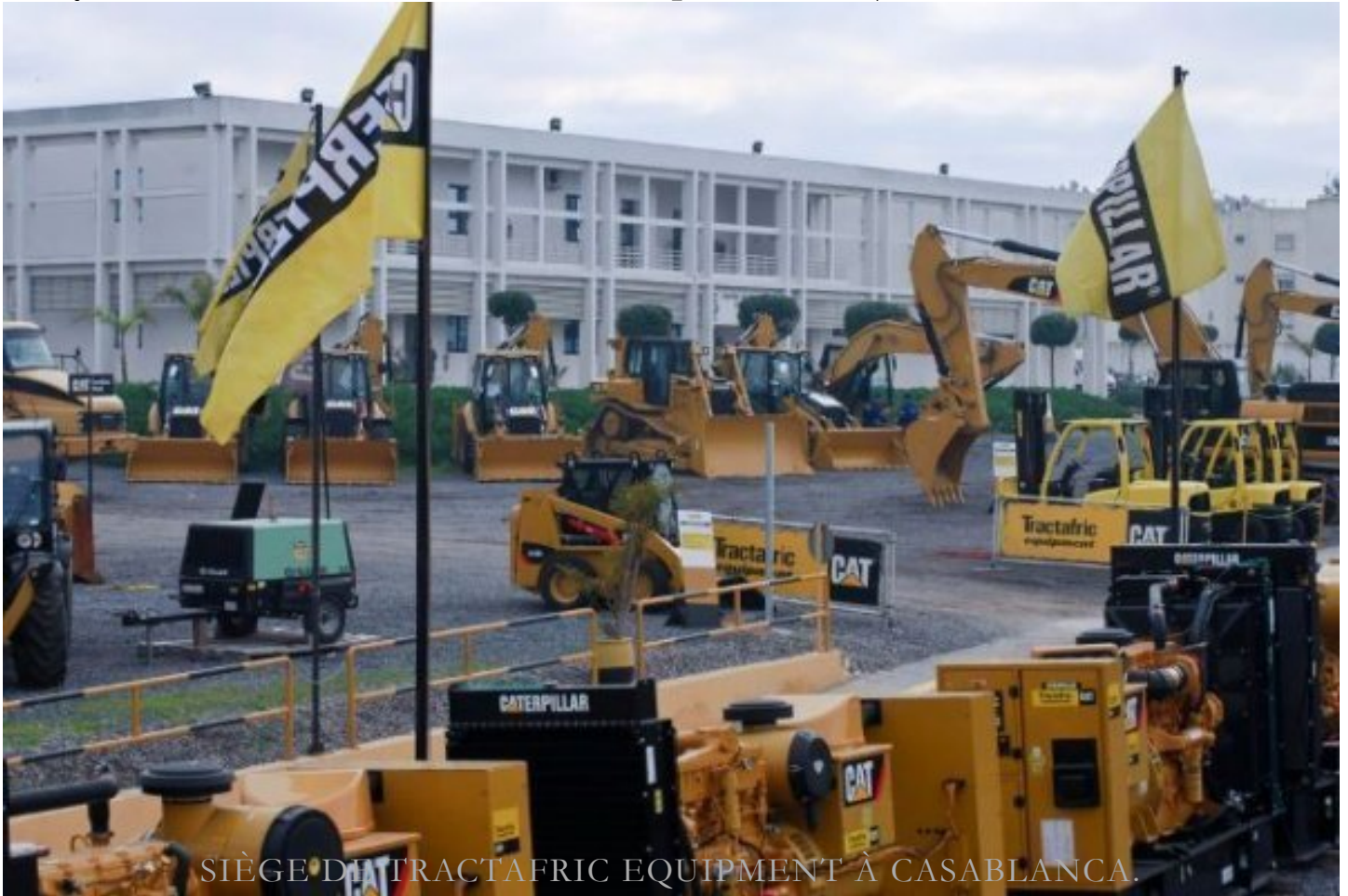
SIÈGE DE TRACTAFTRIC EQUIPMENT À CASABLANCA.

Tractaftric Maroc ouvre à Laâyoune et se fait certifier Caterpillar (/ECONOMIE/ENTREPRISES/6729-Tractaftric-Maroc-ouvre-a-Laayoune-et-se-fait-certifier-Caterpillar.html)