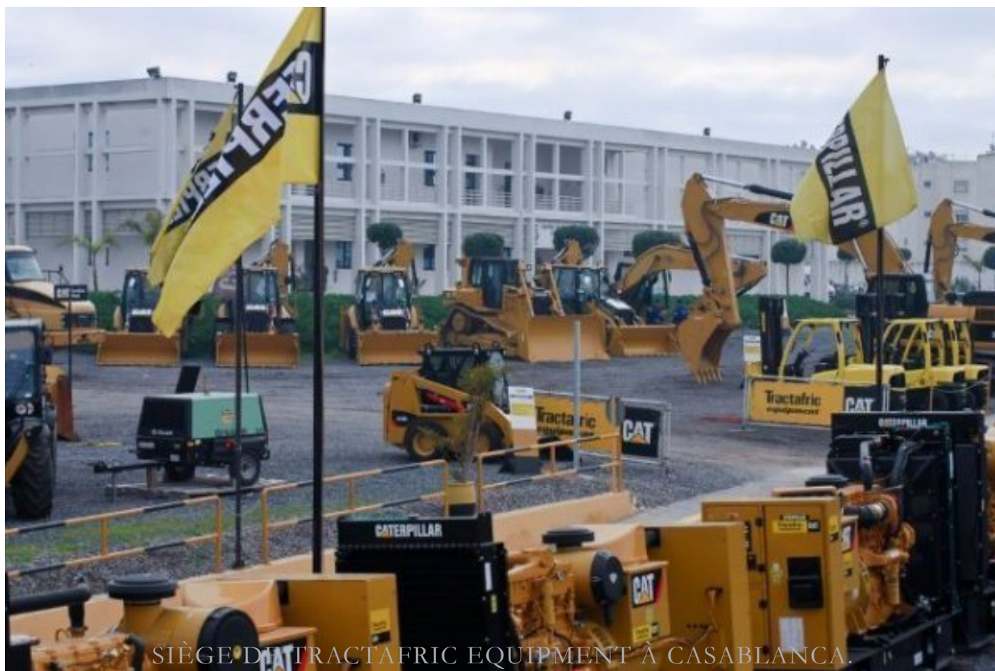
SIÈGE DE TRACTAFTRIC EQUIPMENT À CASABLANCA.

ENTREPRISES (/economie/entreprises.html)